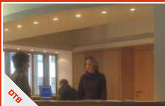
Indirektes Deckenlicht bewahrt den Überblick und schafft Atmosphäre.