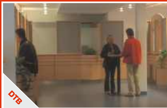
Helle Räume, klare Linienführung – die Rezeptionszone des Landratsamtes.