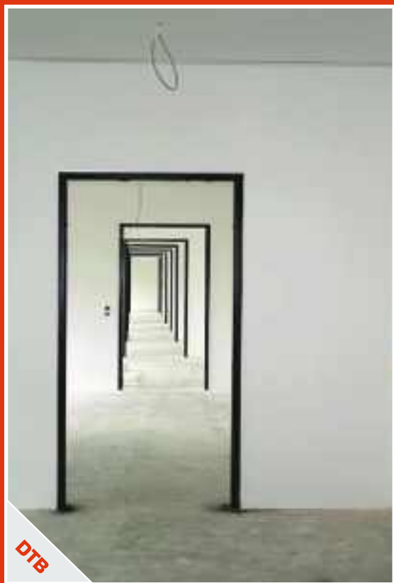
Zimmer mit Aussicht – ein intelligentes Konzept eröffnet neue Perspektiven im Trockenbau.